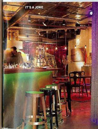
IT'S A JOKE