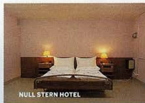
NULL STERN HOTEL